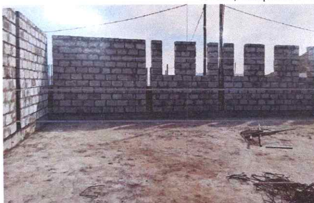
Баянжаргалан сум: Гүйцэтгэгч Их даян бүүвэй ХХК, ажлын гүйцэтгэл 25%