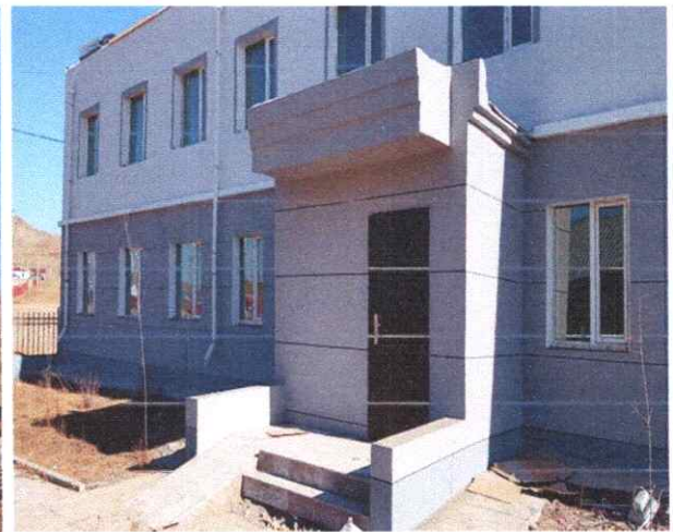
Архуст сум: Гүйцэтгэгч Виста групп ХХК, гүйцэтгэл 100%

Харин Баянцогт сумын ЭМТ-ийн барилгын хувьд төсөвт өртөг “Монгол Улсын 2021 оны төсвийн тухай хууль”-аар 323.2 сая төгрөгөөр илүү батлагджээ.