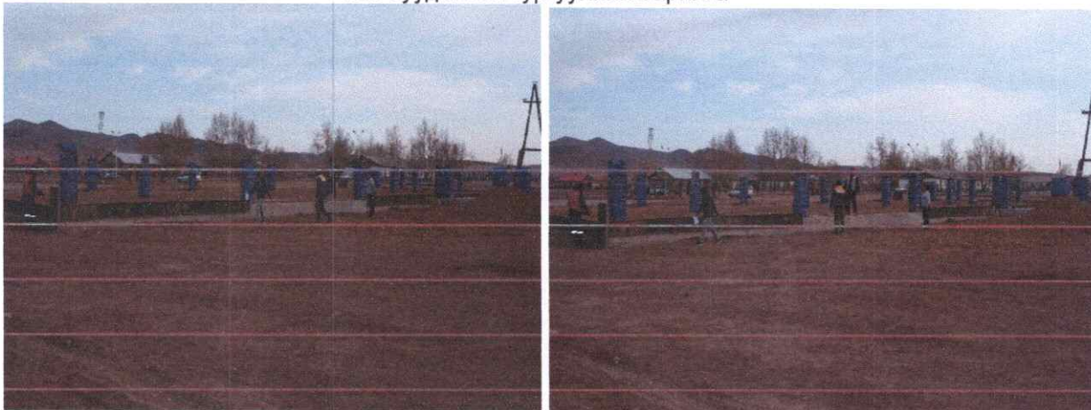
Тайлбар: Заамар сумын Хайлааст багт баригдаж байгаа 320 суудалтай сургуулийн барилга батлагдсан зураг төсөвгүй баригдаж байна.

“Монгол Улсын 2021 оны төсвийн тухай хууль”-аар 20,110.9 сая төгрөгийн төсөвт өртөгтэй 13 ажилд 5,660.0 сая төгрөг буюу төсөвт өртгийн 28 хувьд санхүүжилт батлагджээ.