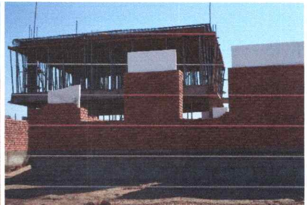
Лүн сум: Гүйцэтгэгч Төв цогт өлзийт ХХК, гүйцэтгэл 30%