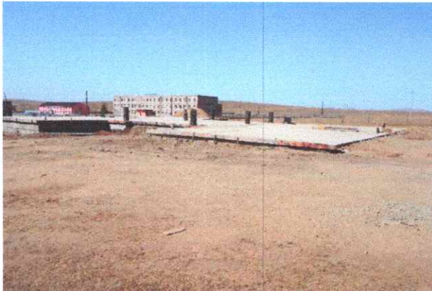
Угтаалцайдам сум: Гүйцэтгэгч Тэнгэрийн долоон од ХХК, гүйцэтгэл 39%

Угтаалцайдам, Лүн сумын 150 хүүхдийн суудалтай цэцэрлэгийн барилга