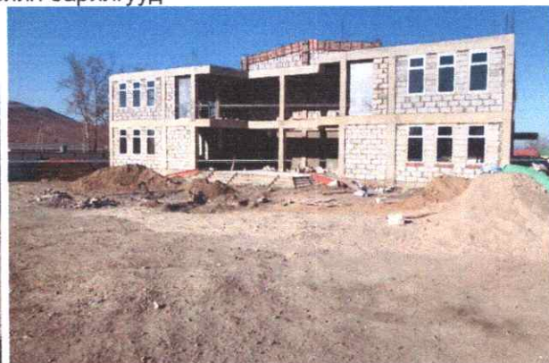
Борнуур сум: Гүйцэтгэгч Жоншт ХХК, ажлын гүйцэтгэл 66 %