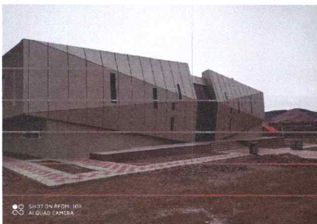
Баянчандмань сум: Гүйцэтгэгч Мета менежмент ХХК, ажлын гүйцэтгэл 88%